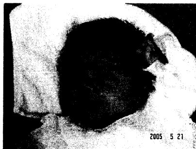
名塚家(湯河原厚生年金病院)

ちょ～かわいい、自慢の我が子の写真を掲載させて頂きました。皆さんどうぞよろちくおねがいちまちゅ！