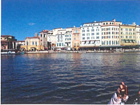
ディズニーシー入り口付近

フリーフォールタイプのアトラクション。落下時には強い浮遊感が味わえるので、スリルは東京ディズニーリゾートのアトラクションの中でも高い部類に入ります。スリルを求める方は、一度は乗っておきたいアトラクションだと思います。人気があるだけに、待機列を飛ばして乗れるファストパスがすぐになくなってしまいますので、欲しい方は入園したらすぐに取りに行くといいと思います。