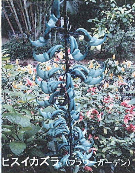
ヒスイカズラ (フラワーガーデン)