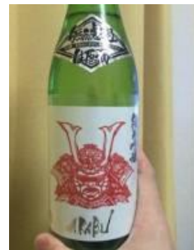
2匹の鯛ラベルのエビスとAKABU