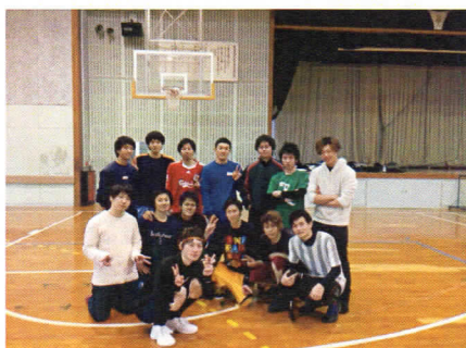
高校時代のバスケ部の仲間たちと

私は静岡県浜松市出身で大学から関東に上京いたしました。入社は2015年と3年目になります。2017年10月より小田原を担当させていただくことになりました。何卒、よろしくお願い申し上げます。静岡県浜松市出身でございます、実家は浜名湖でとれる海の幸をメインに飲食店を営んでおります。浜松に起こしになられる際は足を運んでいただけますと幸いです。小学1年生から大学までバスケットボール部に所属しており、高校では静岡県ベスト16まで進出することができ、根っからのバスケ好きです。現在は趣味の範囲で活動を続けていますが機会がございましたらバスケットボールに打ち込みたいと思います。今後とも皆様にはご指導ご鞭撻のほどよろしくお願い申し上げます。