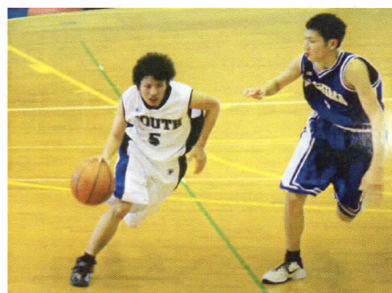
高校2年生の夏の大会