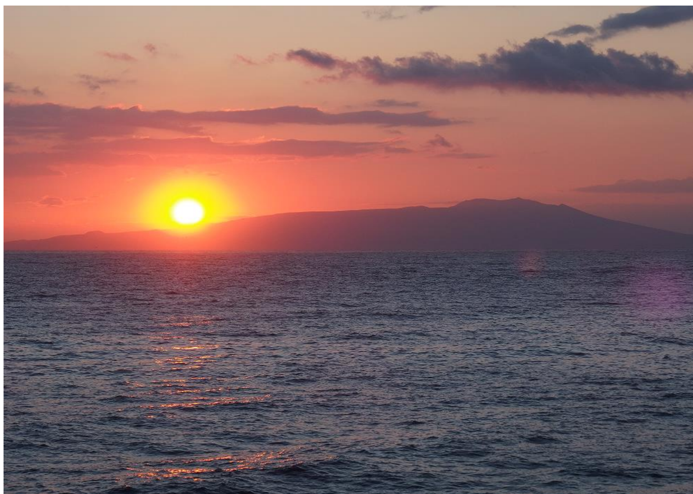
大島から昇る日の出