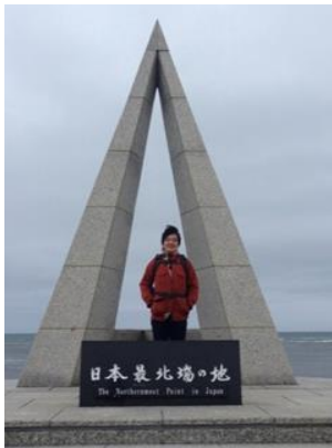
北海道を一周した際の一枚です。

[自己紹介]2017年4月に弊社に入社致しまして、10月より西湘地区を担当させて頂いております。私の出身は愛媛県の新居浜市というところで、学生時代は京都、そして神奈川県と段々と東に居住地が移っております。高いビルに囲まれた街で揉まれる中、西湘地区を訪問させて頂く度に出身地に近いような雰囲気を感じ、少しホッとしている自分がいるというのは内緒でございます。そんな私の趣味の一つはバイクでございます。学生時代に北海道をバイクで一周したのは思い出の一つでございます。神奈川県もバイク乗りにとっては魅力的な場所ですので方々駆け回りたいと思っております。まだまだ未熟者ではございますが、今後ともご指導ご鞭撻の程、何卒宜しくお願い申し上げます。