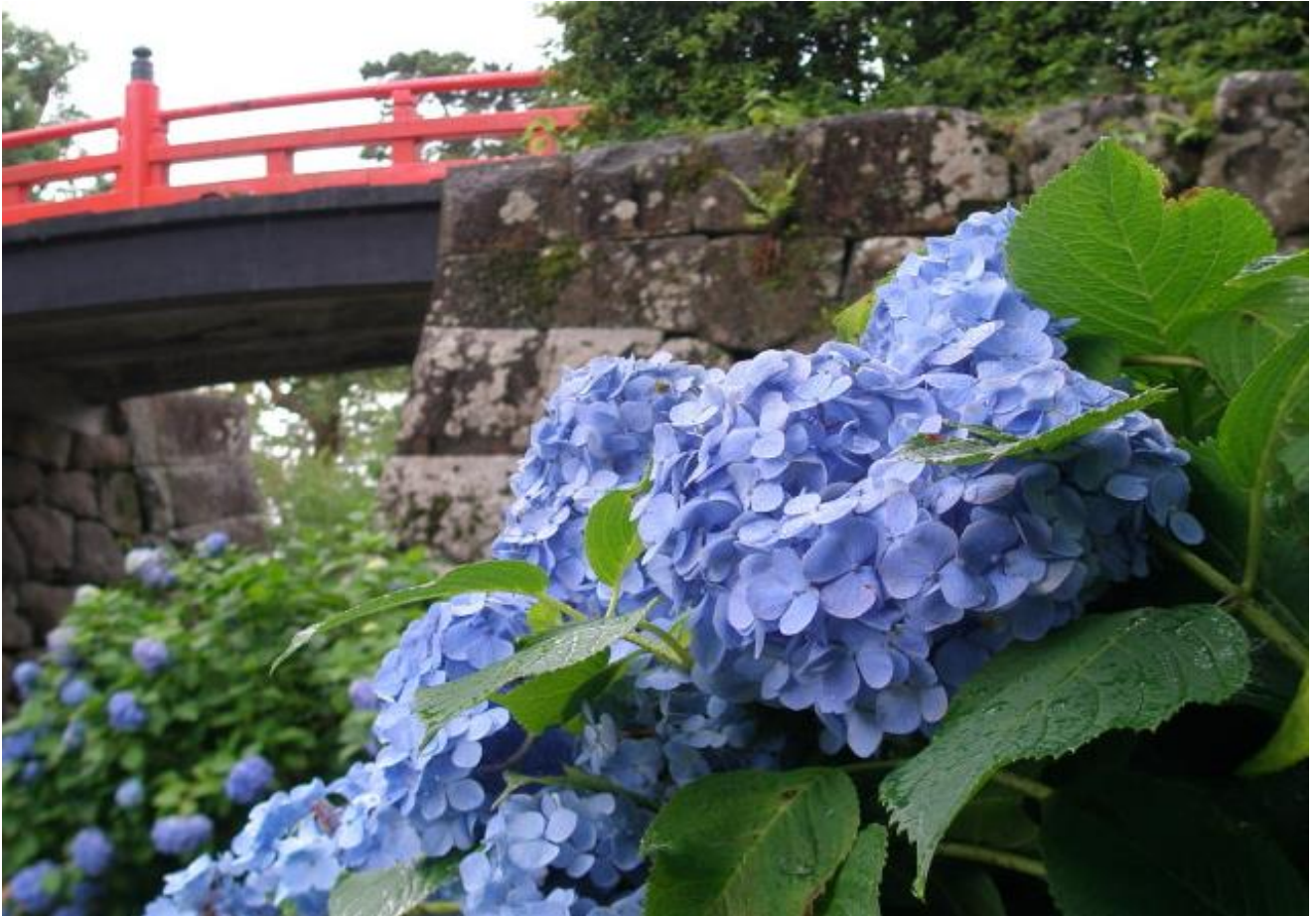
小田原城の紫陽花