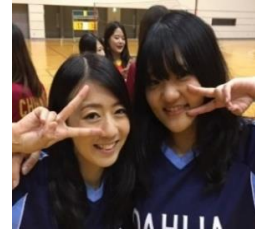
先輩との2ショットです。 私は右になります。