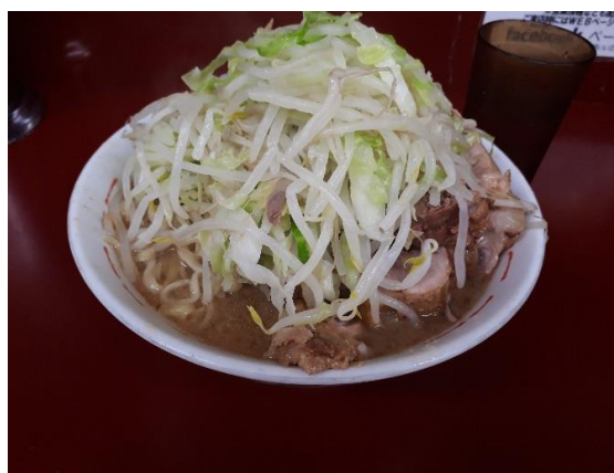
ラーメン二郎 相模大野店