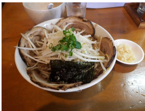
麺の蔵 チャーシュー麺

現在は湯河原にあるラーメン屋を探して食べていますが、今後は小田原のラーメン屋を探していきたいです。