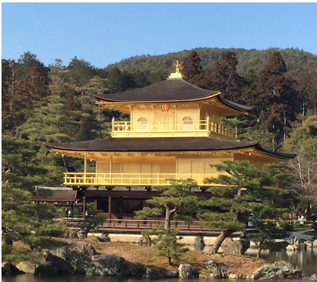
如月の金閣寺