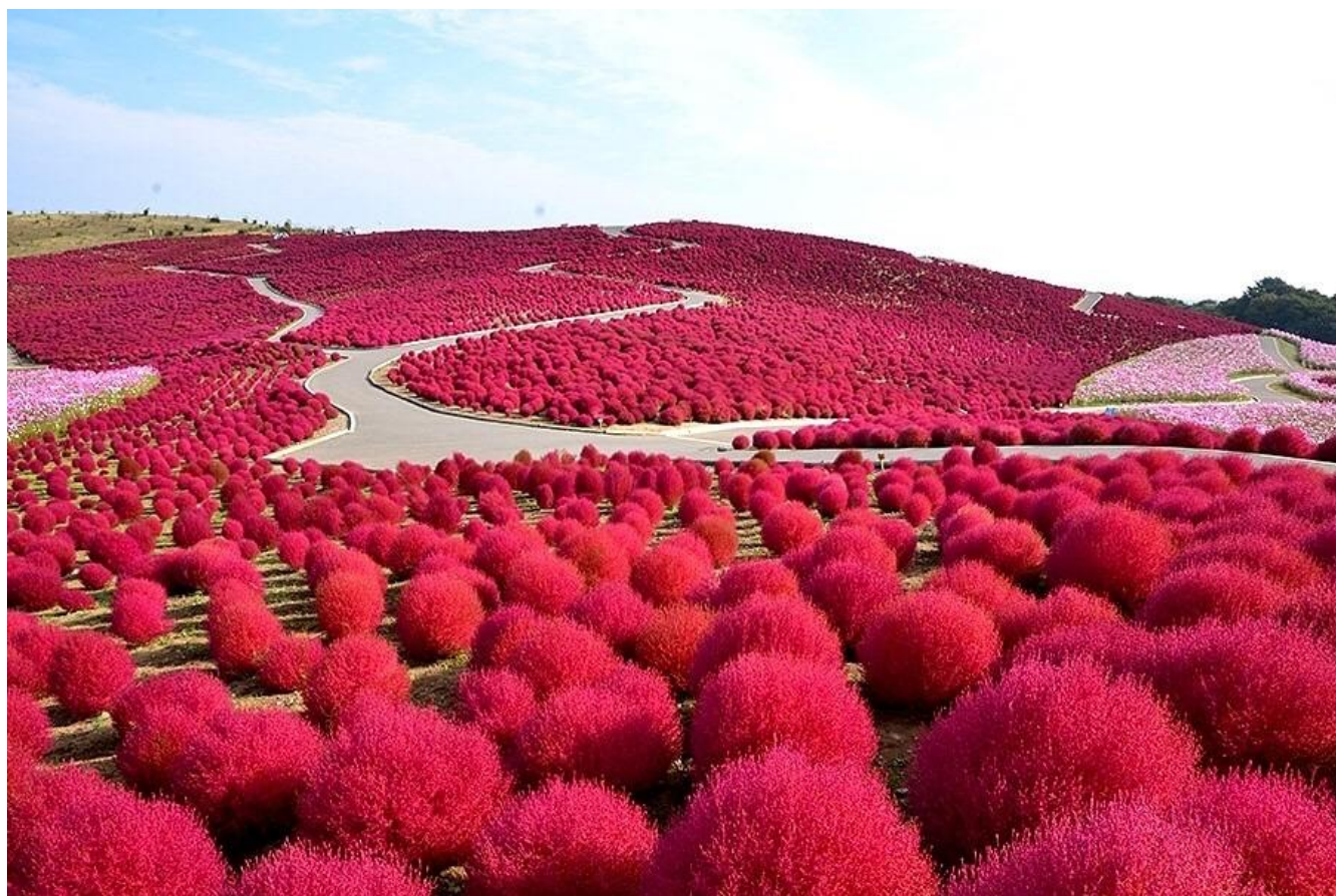
『コキアとコスモス』 国営ひたち海浜公園