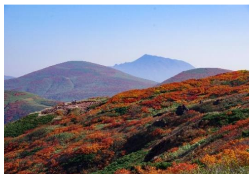
紅葉の秋田駒ヶ岳(秋田)