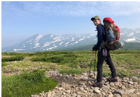
大雪山～トムラウシ縦走にて(北海道)

コロナ禍が落ち着いたら10年来の夢であるスイスの名峰、Matterhornに登りに行きたいものです。