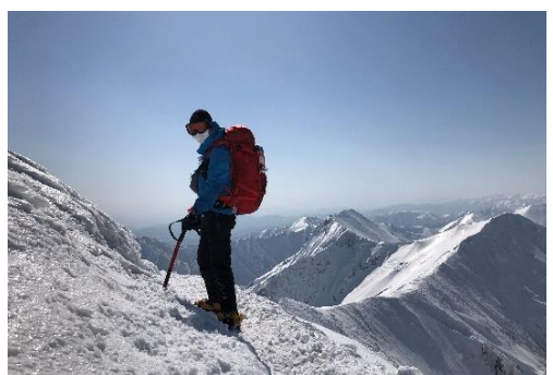
厳冬期の谷川岳(群馬)

最後に、西湘地区ビギナーの私ですが近場で自然を楽しめるお気に入りの場所を一つ。以前クライミングをするのに訪れたことのある湯河原の幕山公園です。梅林がとても美しく、お花見しつつ軽くハイキングするのにおすすめなので是非機会があれば訪れてみてください。