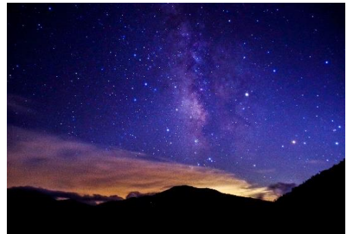
北アルプスの星空(富山)