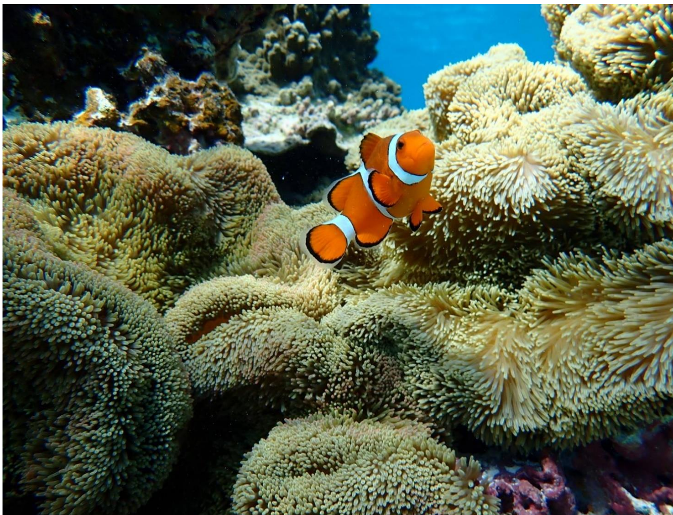
『宮古島のカクレマノミ』