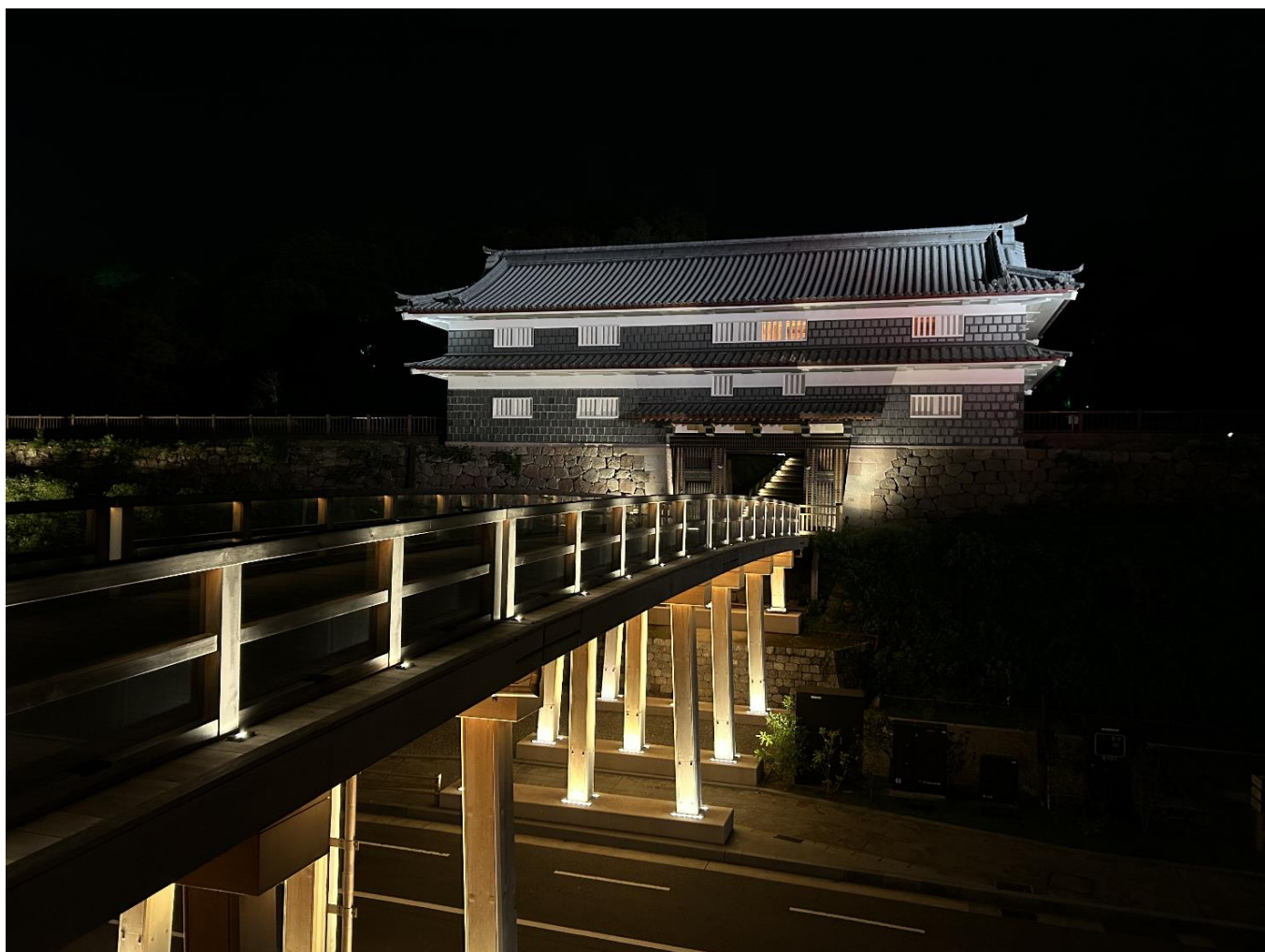
『金沢城 鼠多門』